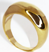
BAGUE LOUISE 140€ PLAQUÉ OR CERTIFIÉ RJC