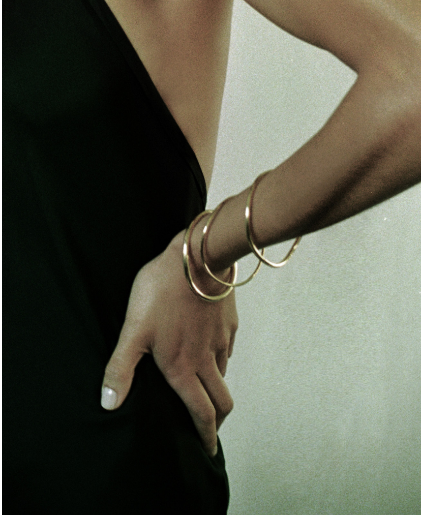
TRIO DE JONCS JESSICA 320€ PLAQUÉ OR FAIRMINED