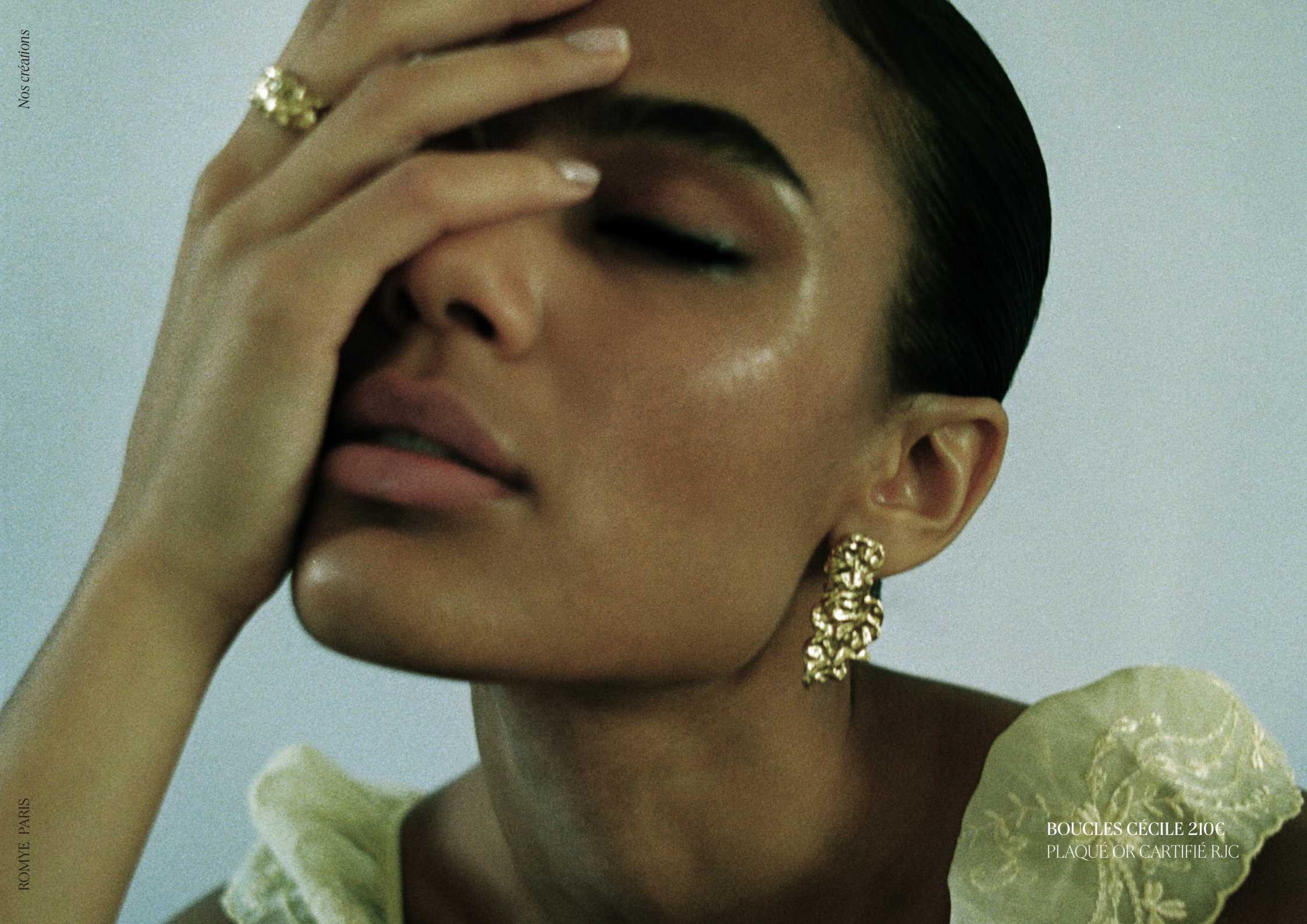
BOUCLES CÉCILE 210€ PLAQUÉ OR CARTIFIÉ RJC