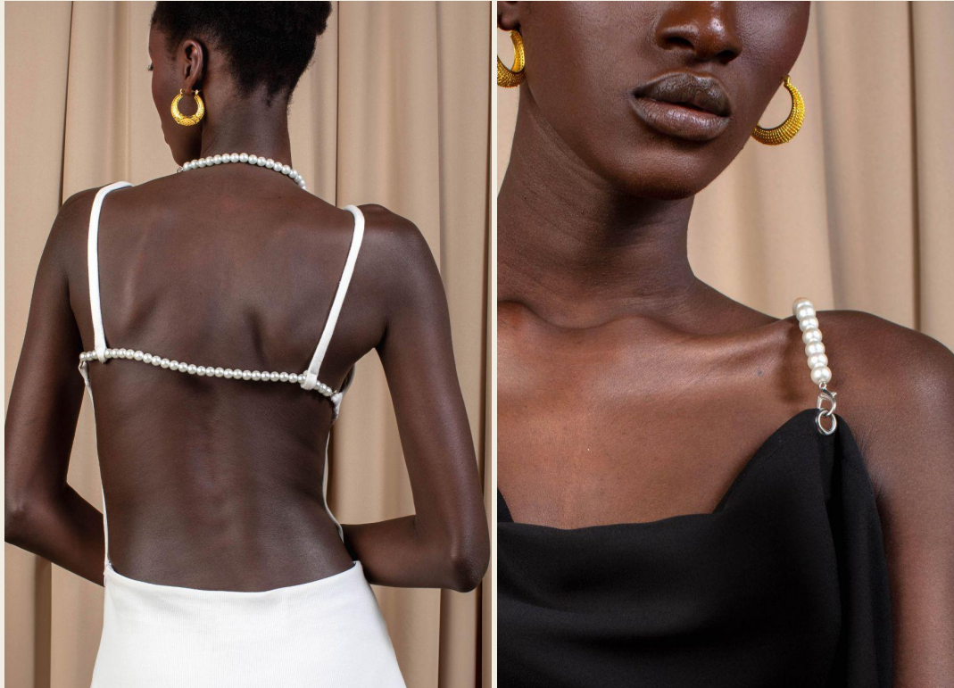
De gauche à droite : Robe Fatdwa, Robe Maxi Dress

Nous travaillons en collaboration avec un artisan spécialisé dans la création des traditionnels "Bine-bine". Ces bijoux, minutieusement confectionnés à la main, étaient traditionnellement utilisés pour orner et souligner la taille des femmes sénégalaises et de la région.