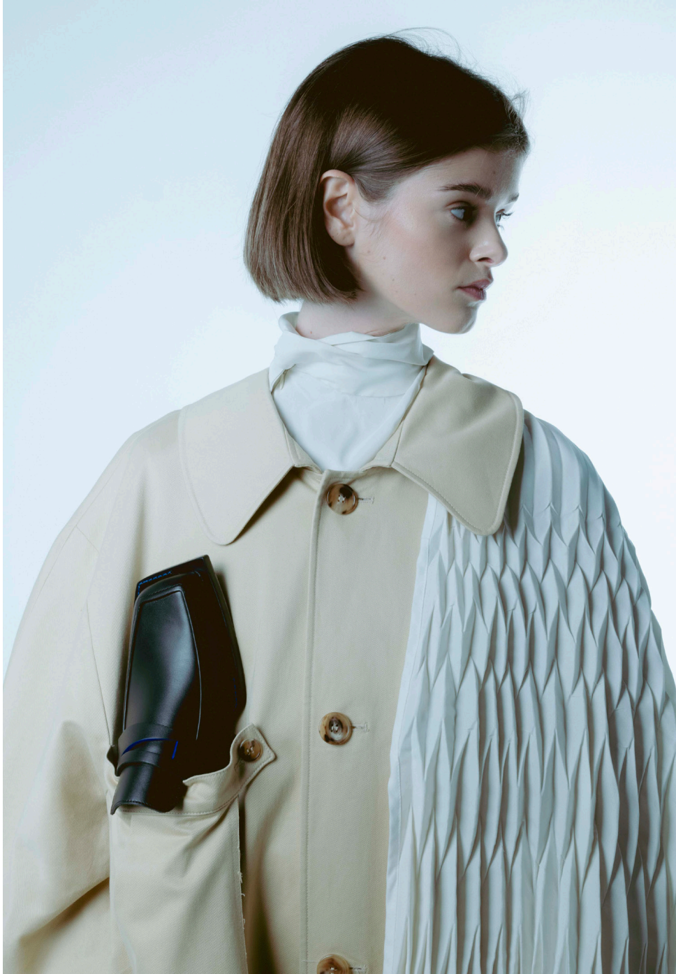
TONKIN 01 POINTURE DU 36 AU 46