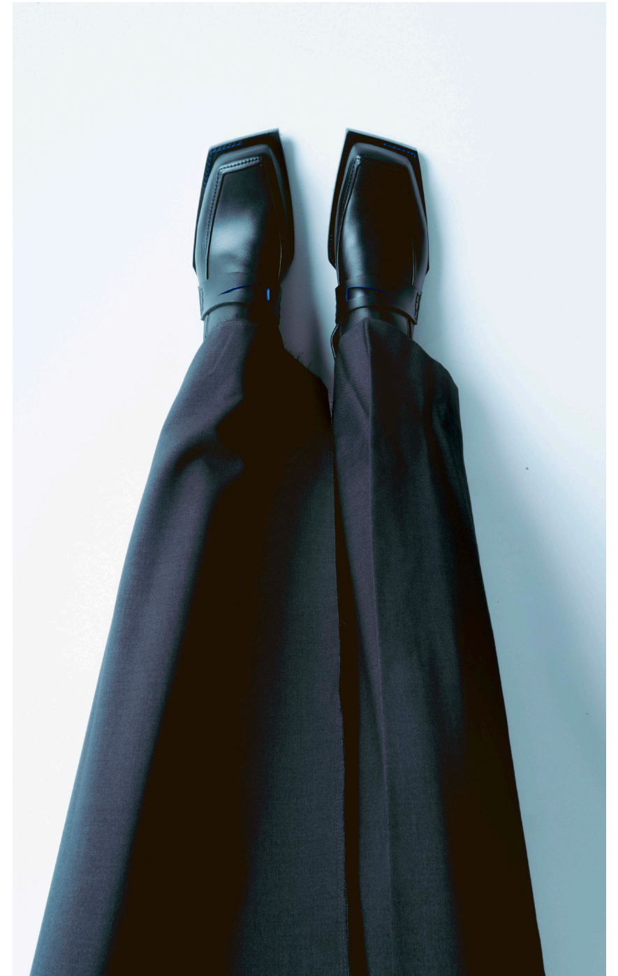
TONKIN 01 POINTURE DU 36 AU 46