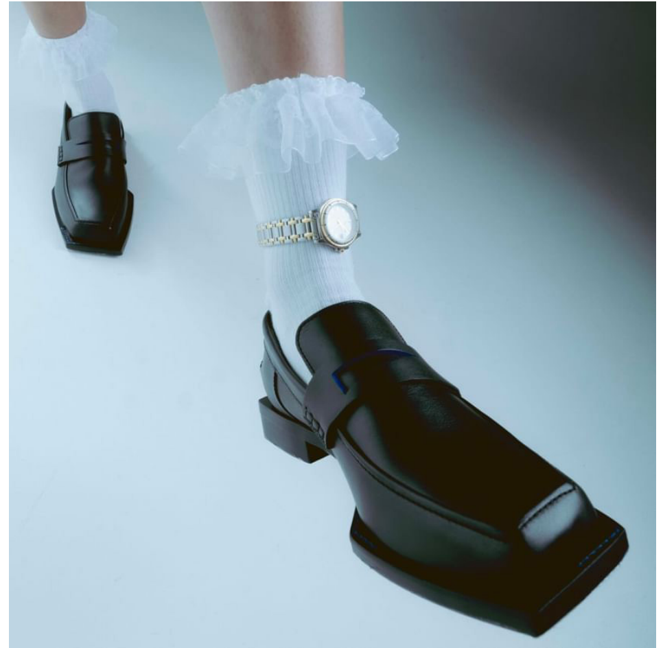
TONKIN 01 POINTURE DU 36 AU 46