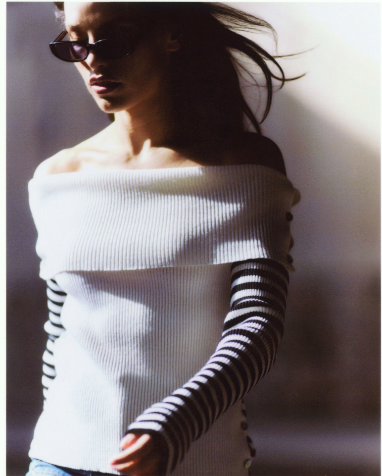
Pull Céphée écru et rayé