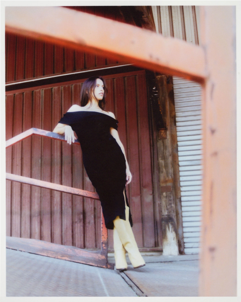
Robe Céphée noire

Céphée reprend le même système de désolidarisation, adapté à une autre forme et prévoit l'ajout de manches, pour un vêtement adaptable à la saisonnalité. Les pulls et robes de cette dernière se déclinent dans trois coloris : rouge, écru et noir rayé selon les modèles. Le tout en laine mérinos mélangée.