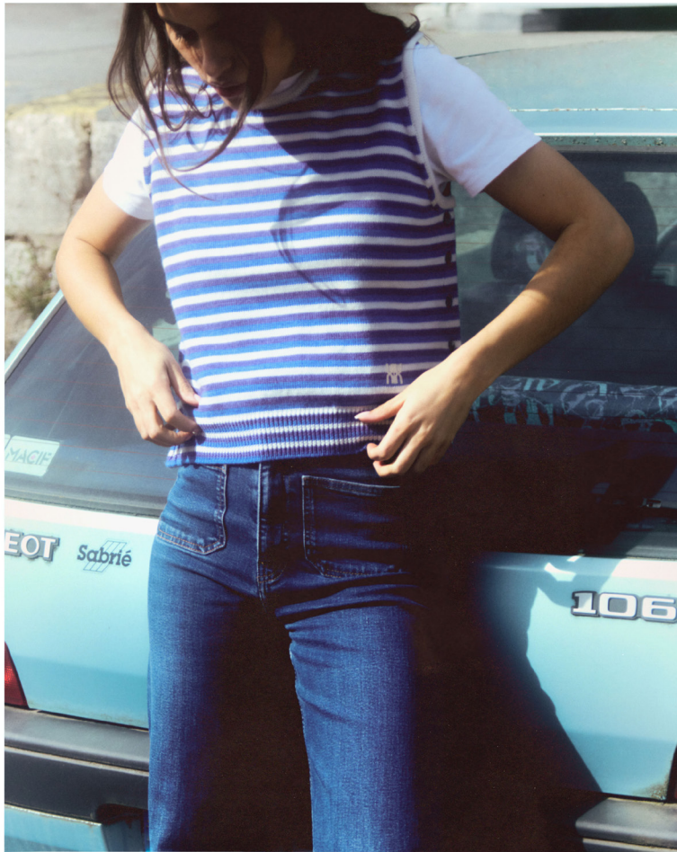
Pull Cassiopée rayé

La collection Cassiopée propose un pull et une robe sans manches, qui grâce à un système de bouttonnière peut dissocier devant et dos. Chacun est libre de créer son habit en choisissant chacune des parties parmi les trois coloris proposés, à savoir écru, gris anthracite et rayé bleu violet écru. Le tout en 100% laine mérinos.