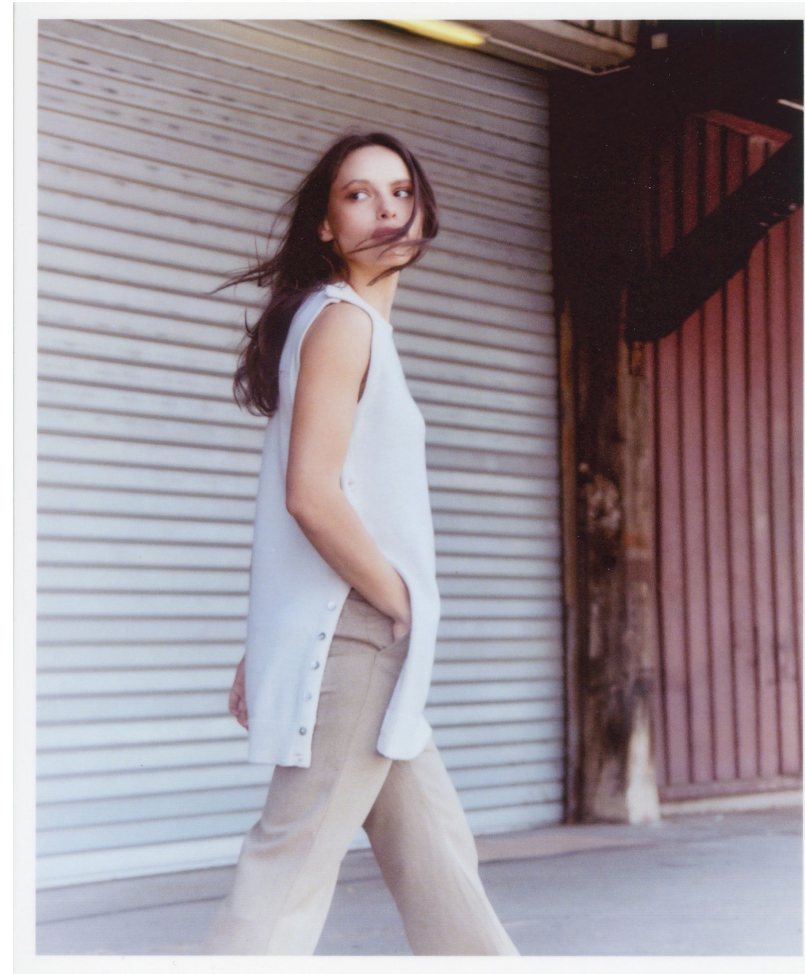
Robe Cassiopée écru